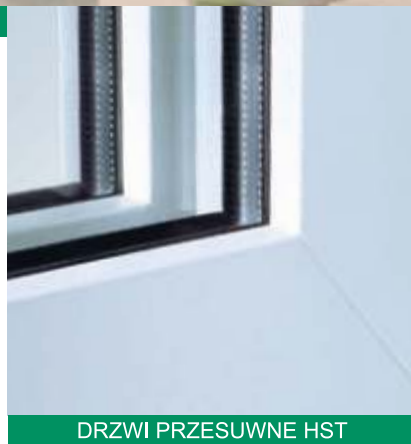
DRZWI PRZESUWNE HST